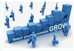
고객사 중국 진출 및 매출 성장 실현