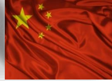
한국 전문가그룹 + 중국 전문가그룹