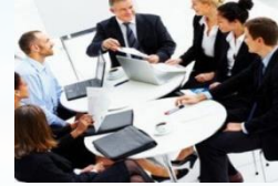
공동 개발 (고객사 맞춤형 서비스)